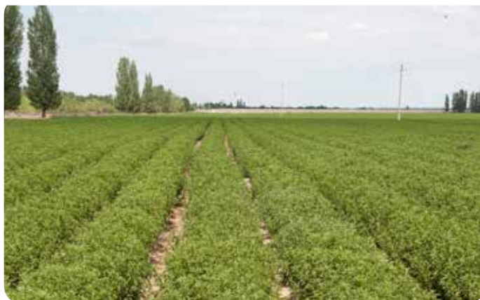
Bayn har produktionskontrakt med fyra av de mest tillförlitliga, väl etablerade steviaproducenterna i Kina.